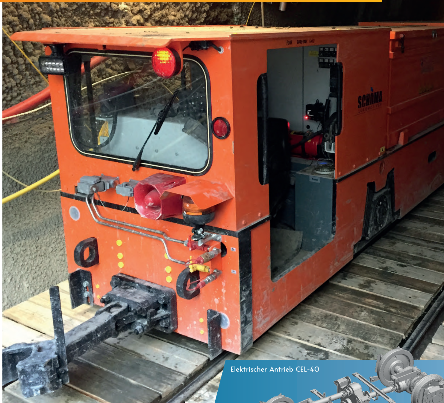
Elektrischer Antrieb CEL-40

Robust / Emissionslos / Feinfühliges Fahren / Verschleißarmes Bremsen & Fahren / Wartungsfreundlich / Energierückgewinnung